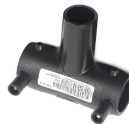
Diamètres 20 à 75 mm