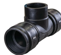
Diamètres 90 à 250 mm