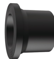
Tous diamètres sauf 560 mm