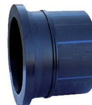
Diamètre 560 mm