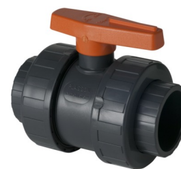
Diamètres 16 à 63 mm

Sans Attestation de Conformité Sanitaire (ACS)