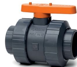
Diamètres 75 à 110 mm