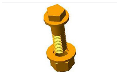
Verrous 1/4 de tour