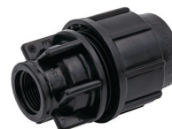
Diamètres 16 mm