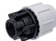
Tous diamètres sauf 16 mm