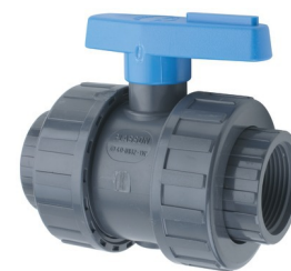
Taraudages 3/8" à 2"

Sans Attestation de Conformité Sanitaire (ACS)