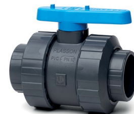
Taraudages 2 1/2" à 4"